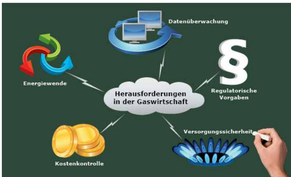
Die Gaswirtschaft steht vor wichtigen Herausforderungen – Mit der richtigen Lösung sind Sie bereit dazu!

Transportnetzbetreiber sind nach Vorgaben der nationalen und europäischen Regulierungsorgane verpflichtet, den Netzzugangsprozess abzuwickeln. Ein ausgeprägtes Kapazitäts- und Nominierungsmanagement ist an dieser Stelle essentiell, um die jeweiligen Zählpunkte zu bestimmen und eine ausgeglichene Energiemengen- und Kapazitätsbilanzierung zu gewährleisten. Das SAP EDM, add-on for gas bietet Ihnen als Transportnetzbetreiber genau diese Erweiterung für die Standardfunktionalitäten Ihres SAP IS-U. Gasstationen erhalten eine Kapazitätssicht, die es ermöglicht, zusätzlich zur Darstellung der Gasnetztopologie auch Informationen zur Kapazitätssituation an den jeweiligen Netzkopplungspunkten abzubilden. Neben der technisch maximalen Kapazität lässt sich zudem eine Abbildung der gebuchten